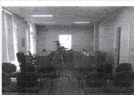
VISTA DA SALA DO PLENÁRIO