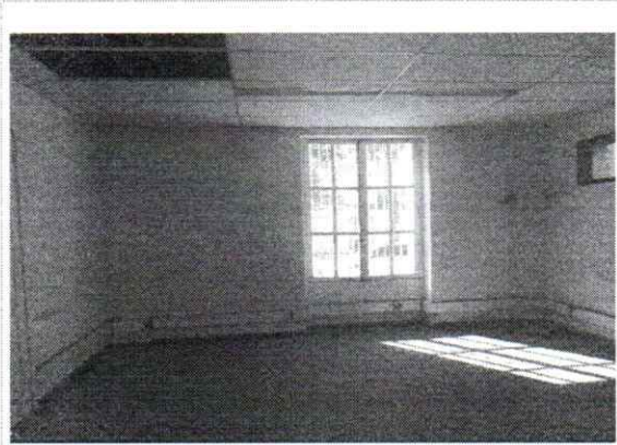
VISTA DE UMA DAS SALAS