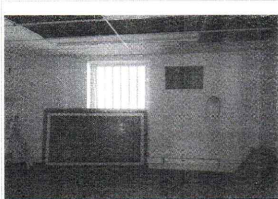
VISTA DE UMA DAS SALAS