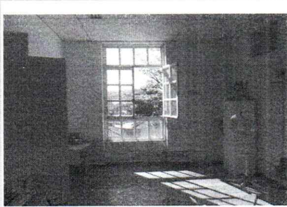
VISTA DE UMA DAS SALAS