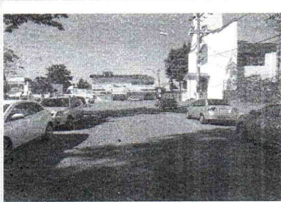
VISTA DO LOGRADOURO