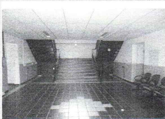
VISTA DO SALÃO / ENTRADA