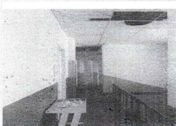
VISTA DA ÁREA DE CIRCULAÇÃO DO 2º PAVIMENTO